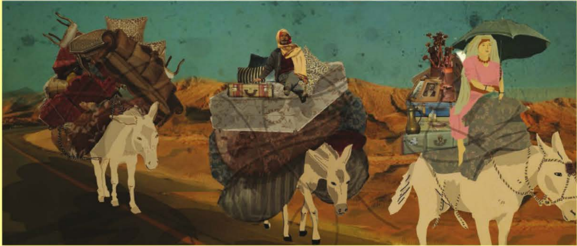
מתוך המיזם "929 - קוראים תנ"ך ביחד"